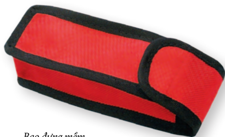
Bao đựng mềm